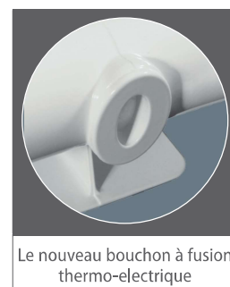
Le nouveau bouchon à fusion thermo-electrique

FONDITAL présente Le nouveau bouchon à fusion thermo-electrique. Le bouchon écologique