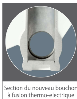
Section du nouveau bouchon à fusion thermo-electrique